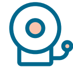
Incidenten & calamiteitenonderzoek

De juiste mensen op het juiste moment: alleen zo garandeert u een continue dienstverlening. Valt er onverwacht iemand weg? En is er binnen uw organisatie niemand om dat op te vangen? Schakel Kerteza in. Onze adviseurs hebben ruime ervaring opgebouwd binnen verschillende organisaties en op diverse niveaus. Zij helpen u uit de nood, zo lang u hen nodig hebt.