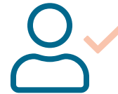
Toetsingen & audits

Een greep uit het aanbod: kwaliteitsmanagement en norminterpretatie, risicobeheersing, management en leiderschapsontwikkeling, lean en opleiding tot interne of externe auditor.