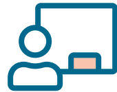
Opleidingen & trainingen

Een verandering doorvoeren binnen uw bedrijf? Het verloopt niet altijd zonder slag of stoot. Zeker als het gaat om meerdere projecten tegelijk, is het soms moeilijk om het overzicht te bewaren en te managen. En laat dat net de sterkte zijn van de adviseurs van Kerteza. Wij nemen u bij de hand en begeleiden u zonder struikelen naar de finish.